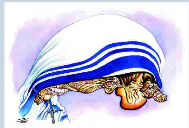
3.º Prémio Caricatura “Madre Teresa de Calcutá”, por Santiago, publicado no jornal regional “Repórter do Marão”

Colaborador nos jornais: «O Comércio do Porto»; «O Repórter de Amarante»; «A Verdade» de Marco Canaveses. Membro da FECOPORTUGAL (Associação de Cartoonistas).