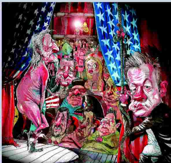
1.º Prémio Editorial “Wikileaks e o Tio Sam”, por Rowe, publicado no “The Sun-Herald Tribune”, Austrália