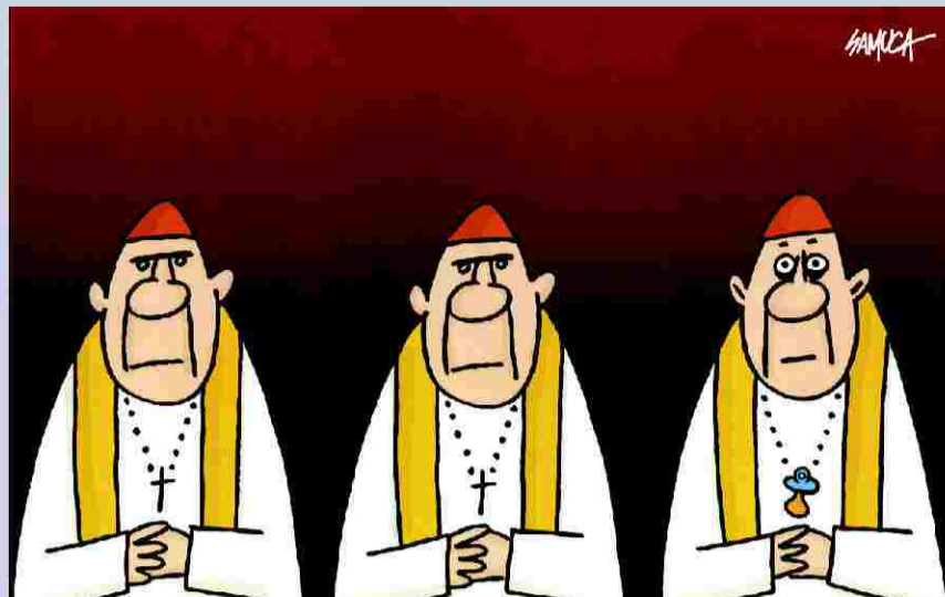
1.º Prémio GAG “Pedofilia”, por Samuca, publicado no “Diário de Pernambuco”, Brasil

Entrega de prémios e Abertura da Exposição