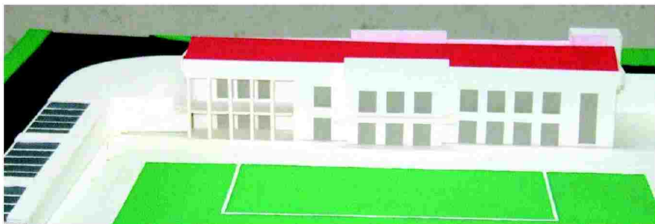
Maqueta do edifício da futura sede do FCA

A concluir, os dirigentes do FCA acrescentam: “Quando o edifício da nova sede e o espaço envolvente estiverem concluídos a festa anual da aldeia passará a ser realizada neste espaço, que reunirá óptimas condições para o efeito, pelo que toda esta obra será uma mais-valia para a aldeia e suas gentes”.