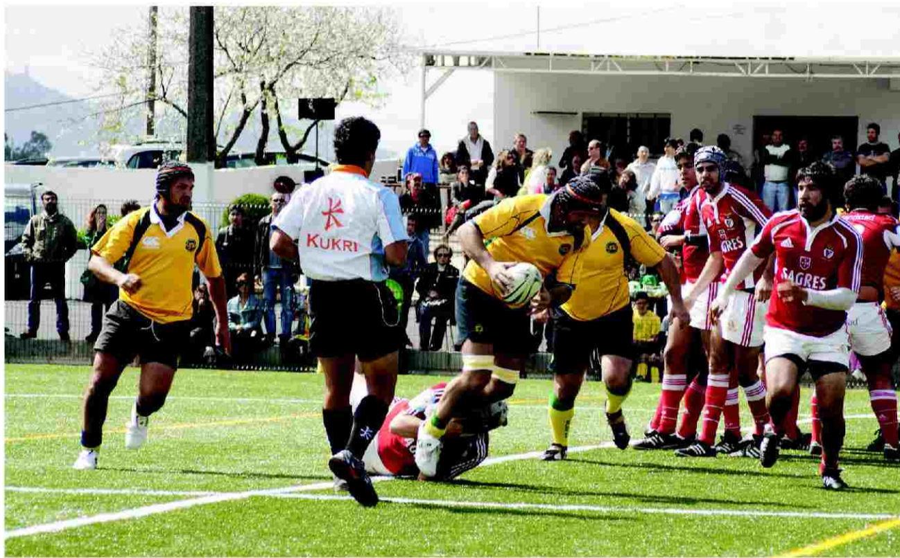
Belas e Benfica estreiam piso sintético no Campo António Pinheiro Pinto Basto

Para os quartos de final não haveria muito por onde escolher já que todas as equipas da II e I divisões tinham ficado pelo caminho restando apenas para além do Belas, 7 equipas da Divisão de Honra. Coube ao clube do concelho de Sintra receber a equipa do S.L. Benfica, no regresso ao Campo de Jogos António Pinheiro Pinto Basto, pertencente ao Clube Desportivo de Belas, agora com piso de relva sintética. Graças ao apoio da Câmara Municipal de Sintra e do Clube Desportivo de Belas foi possível o regresso do Rugby a Belas, depois de vários anos fora da freguesia, concretamente na Agualva, onde também graças a um protocolo com o Ginásio Clube 1.º de Maio, foi possível manter a actividade. E foi um regresso em festa já que o novo sintético tinha sido inau-