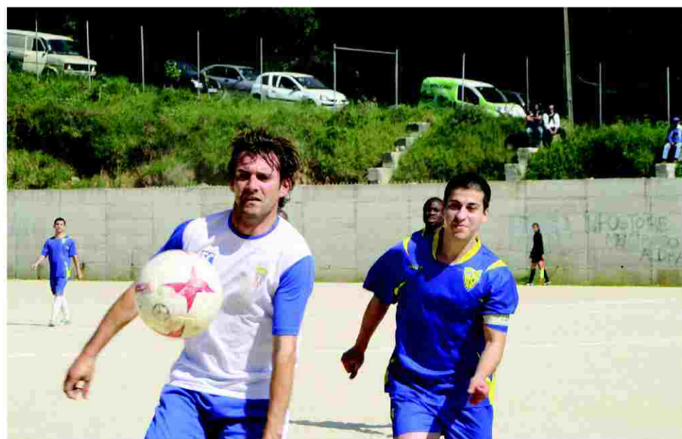
Atlético de Porto Salvo mais feliz no pelado da Tapada

classificada, a 3 pontos dos oeirenses. À espreita fica o "histórico" Palmense (2.º) que pode ainda vir a ser o campeão desta série que teve o Sintra Football (agora 5.º) entre os candidatos, mas que ficou de fora há algumas jornadas atrás. União das Mercês e Algueirão somam os mesmos pontos (27) e ocupam o 9.º e 10.º lugar, respectivamente.