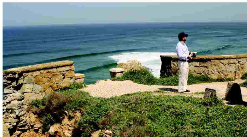
Arribas das Azenhas do Mar sem recuperação à vista

ao litoral de S. João das Lampas, vamos elaborar um relatório para enviar às entidades competentes nesta matéria. Estas não podem funcionar de costas voltadas para Sintra, um concelho onde