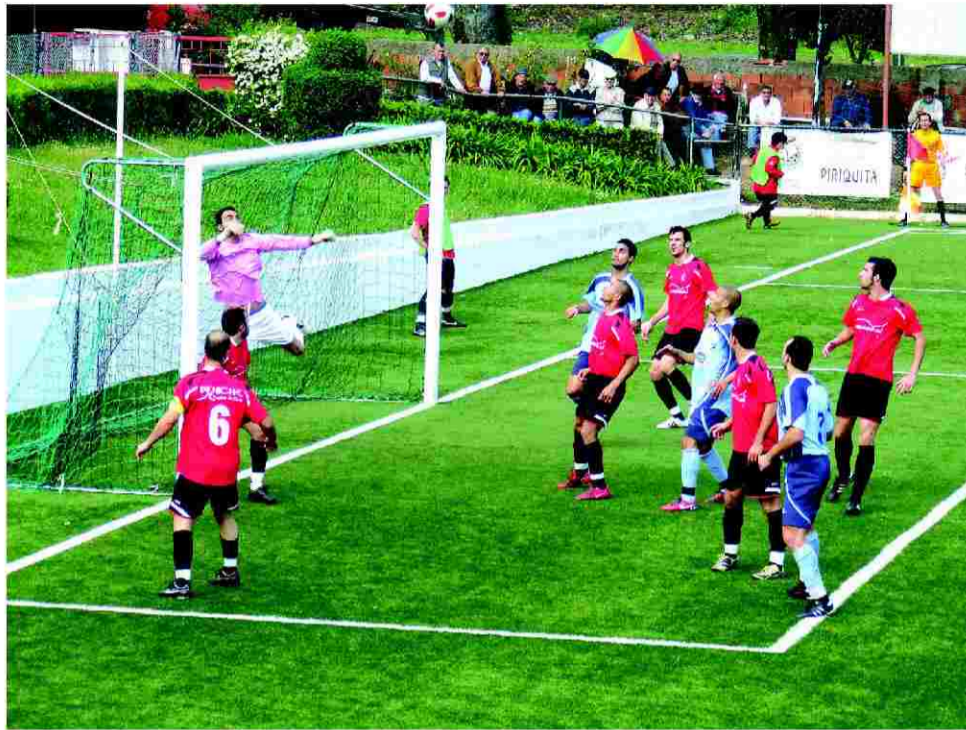
Guarda-redes do Peniche afasta o esférico com uma espectacular defesa

No início do segundo tempo o Peniche, sem nada a perder, arrisca mais, pressiona, e aos 54 m Tiago reduz a diferença no marcador (3-1). Com este golo o Peniche cresceu ainda mais, levando o perigo à área contrária, mas os donos da casa, mais acutilantes nos seus ataques, aos 76 m marcaram o seu quarto golo (4-1),