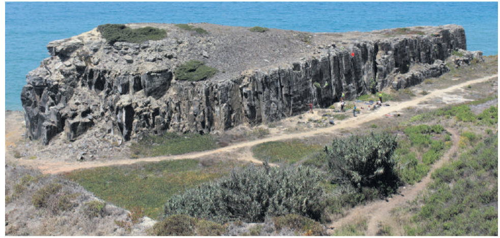
Lomba de Pianos