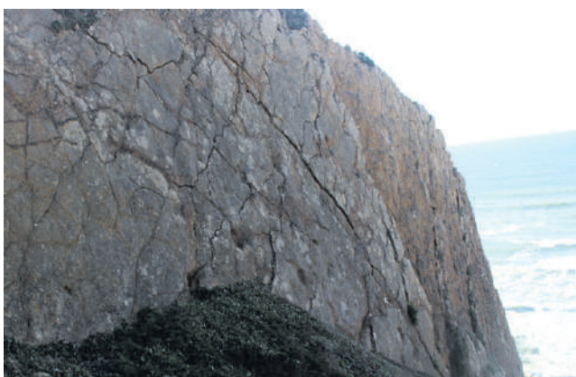
Pegadas de Dinossauro na Praia Grande