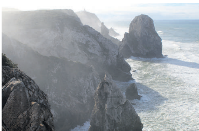
Pedra da Ursa