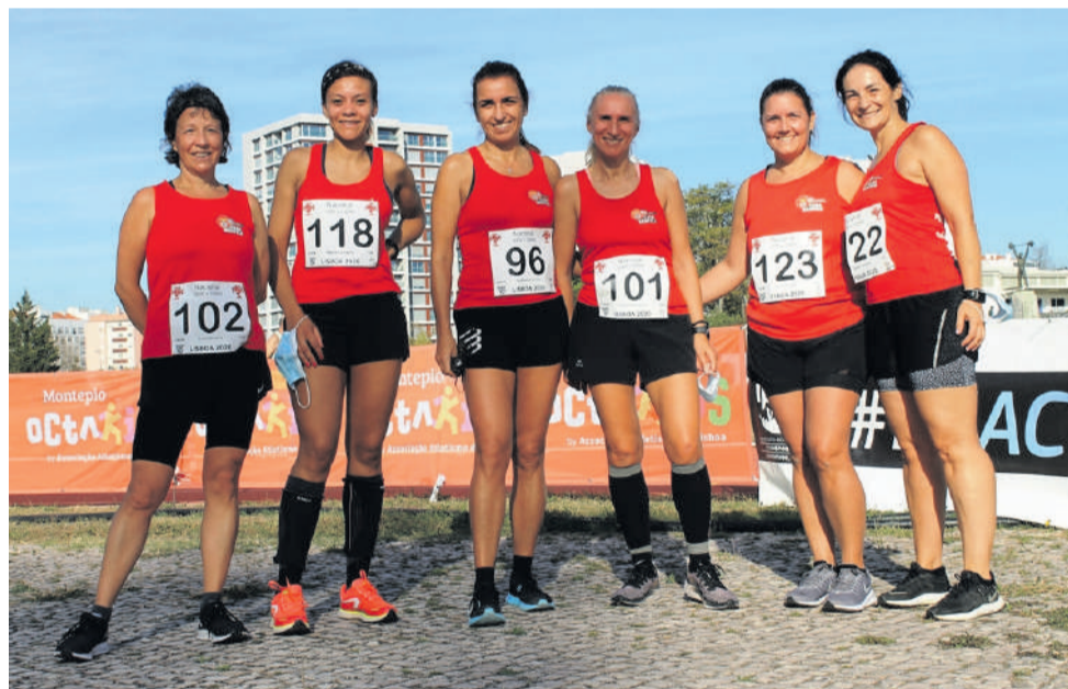
Equipa feminina da Casa Benfica em Algueirão-Mem Martins nos 5 000 metros

ajuntamentos e os contactos entre atletas. No final, todos relevaram a excelente organização, disciplina, e rapidez de resultados, numa parceria da Associação de Atletismo Veterano (ANAV), Associação de Atletismo de Lisboa (AAL, e dos Juizes e Crono-