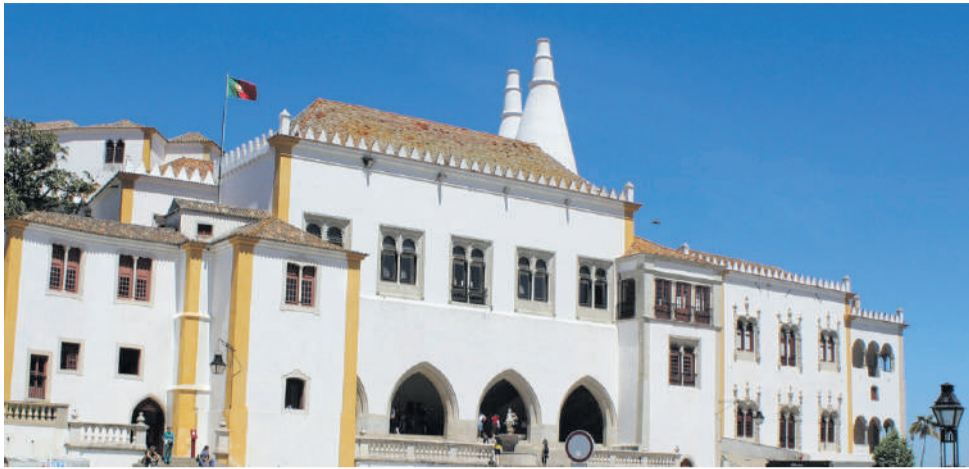
Palácio da Vila