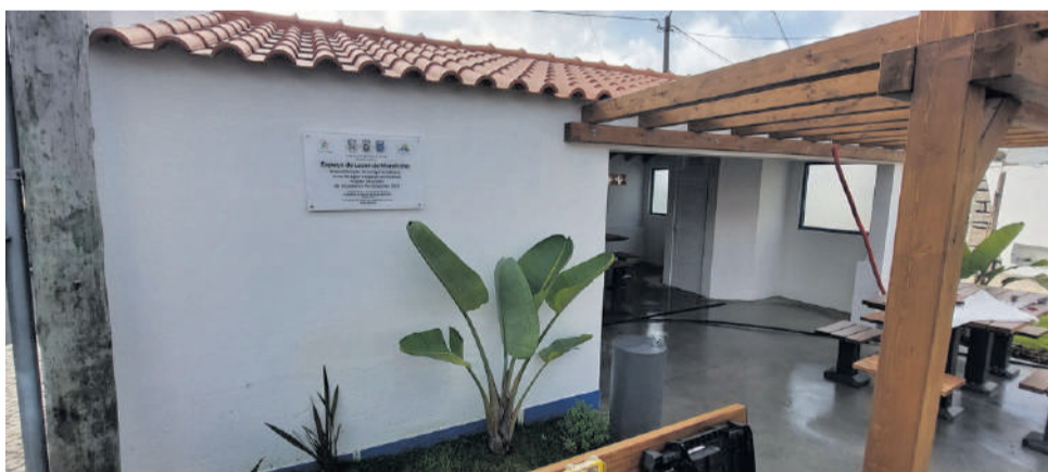
Antigo lavadouro é agora zona de lazer e convívio da população

saquinhos de plástico para serem usados na apanha desses dejectos” prometeu o presidente.