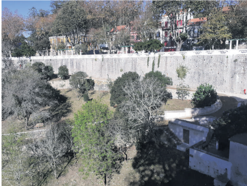
Vale da Raposa

A segunda fase desta intervenção, com um prazo de execução estimado em oito meses, visa concretizar o Jardim Romântico do Vale da