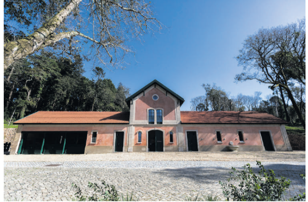
Abegoaria do Parque da Pena

A exposição é uma linha do tempo com as 67 capas, em grande formato, dos livros publicados até hoje, incluindo, igualmente, algumas curiosidades sobre a coleção. A viagem começa em 1982, ano do primeiro livro, “Uma Aventura na Cidade”, e segue até 2024, ano em que foi editado o volume mais recente, “Uma Aventura na Torre do Tesouro”. A iniciativa pretende celebrar a