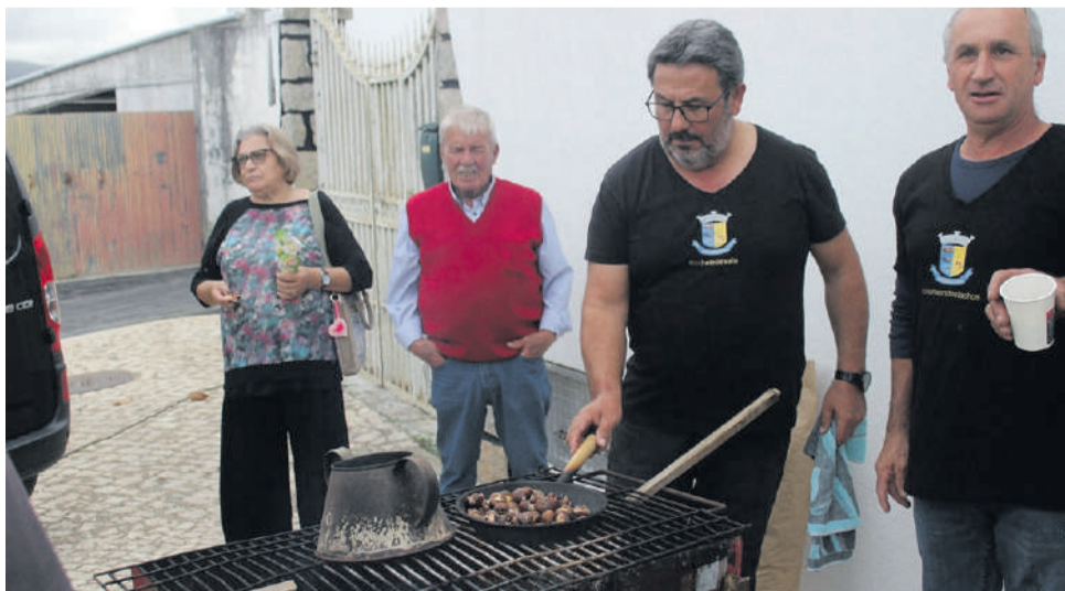
Equipa de serviço às castanhas. Ora assadas, ora fritas