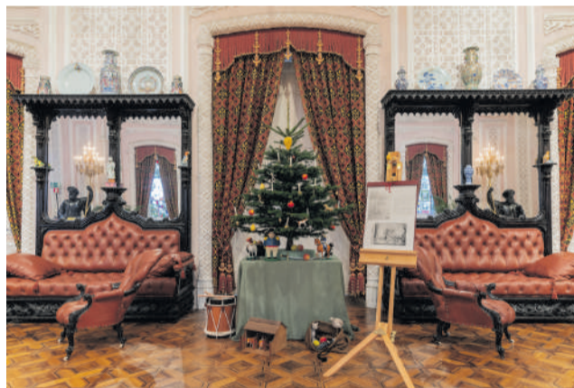
Árvore de Natal de D. Fernando II no Salão Nobre do Palácio Nacional da Pena

Para que nada falte na noite da consoada, há que organizar todos os detalhes com antecedência. Na Quintinha de Monserrate, a atividade “A Quintinha prepara o Natal”, agendada para 7 e 21 de dezembro, às 10h30, envolve toda a família nos preparativos para a grande festa. Recebidos por personagens que são típicos saloios de Sintra, os participantes são convidados não apenas a participar nos afazeres quotidianos da quinta, mas também nas tarefas tradicionais desta quadra festiva, como a confeção do bolo-rei. En-