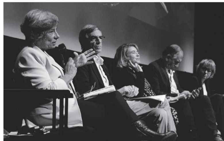
Mesa-redonda “Os Municípios na Vanguarda da Sustentabilidade Europeia”

A Conferência Final Internacional contou com o apoio institucional da Comissão de Coordenação e Desenvolvimento Regional de Lisboa e Vale do Tejo I.P (CCDR LVT), Agência Portuguesa do Ambiente (APA), Direção-Geral de Educação (DGE), Direção-Geral dos Estabelecimentos Escolares (DG EstE), Instituto da Conservação da Natureza e das Florestas (ICNF), Geoparque Oeste, com o apoio da MOP Solidária e do Pacto Climático Europeu, a parceria média da CISION, e cofinanciamento pelo programa ERASMUS+ e pelo Fundo Ambiental.