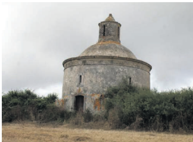
Mãe d'Água, localizado na Fervença

Este artigo pretende ser um singelo contributo para a comemoração deste relevante Dia para o município sintrense, pois só conhecendo o que