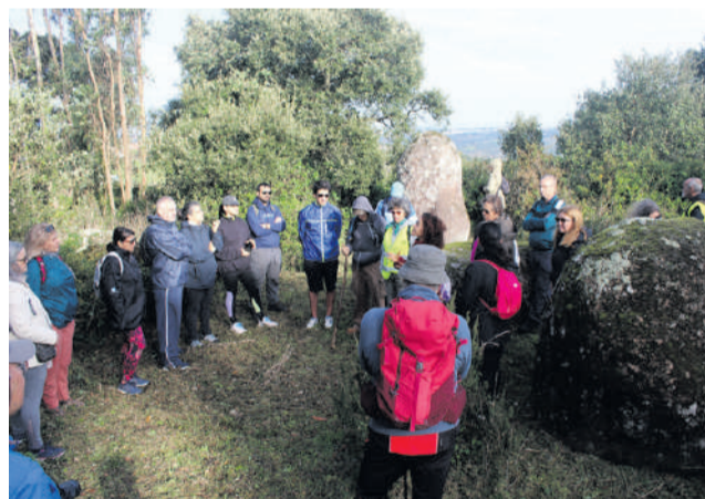
Monumento megalítico da Barreira