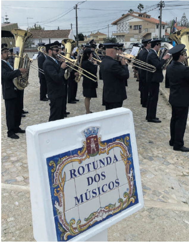
Nova Rotunda junto à Capela, um reconhecimento a todos os músicos

O ponto alto das comemorações estava guardado para o final do almoço comemorativo que se iniciou pelas 13h00. Foram entregues me-