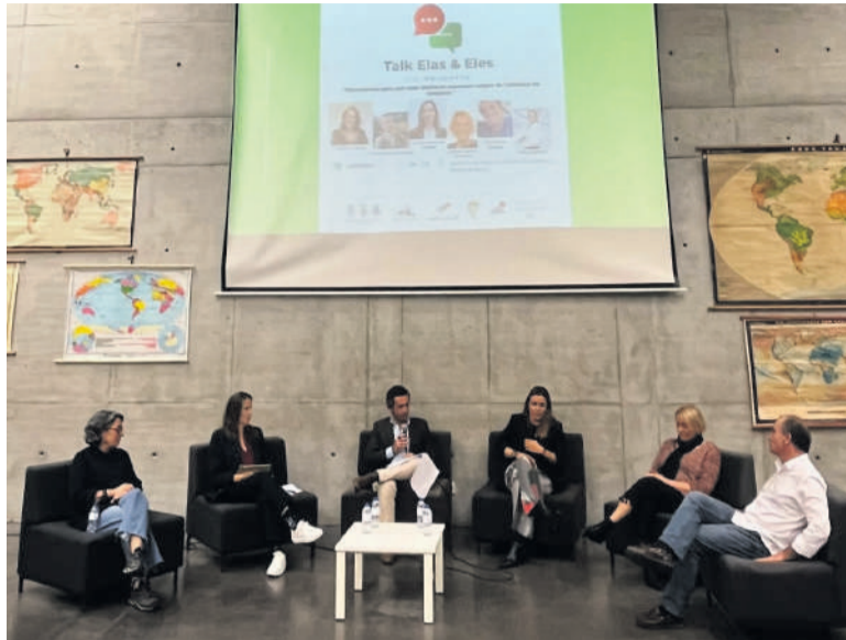
Painel de convidados que debateu o tema proposto

A iniciativa foi da Academia de Judo Filipa Cavalleri com Sede em Janas, e reuniu dirigentes desportivos, atletas, membros da comunidade educativa e encarregados de educação, num debate inspirador e enriquecedor sobre igualdade de género no desporto.