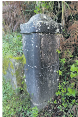
Marco de Légua,

apresenta é o do Marco de Légua, muito próximo de Colares, na Estrada Nova da Rainha, que há muito pouco tempo foi identificado pelo autor deste artigo. Este Marco parece ser desconhecido da Câmara Municipal de Sintra e da Junta de Freguesia de Colares, pois não se encontra nenhuma referência ao mesmo. Sobre a relevância dos Marcos de Légua destaca-se que o Jornal de Sintra publicou em 25 de março de 2022 um artigo sobre este assunto com o título “Marcos de Lé-