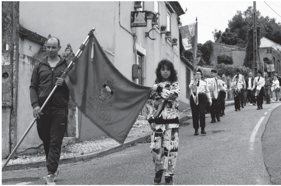
Fanfarrinha dos Bombeiros Voluntários de S. Pedro de Sintra animou as ruas de Rio de Mouro Velho para assinalar os 137 anos da Colectividade

A Sociedade I.º Dezembro de Rio de Mouro foi resistindo aos novos tempos e ao crescimento do modelo urbano, como dormitório, e completou 137 anos. As comemorações começaram em Novembro (dia 17), com a peça de teatro “Vamos de Férias Manel”, com o Grupo Cénico Os Atrevidos de Pêro Pinheiro, e teve o seu ponto alto no passado dia 1, dia do aniversário que começou com a celebração da Missa em memória dos sócios falecidos, e um desfile pela Fanfarrinha dos