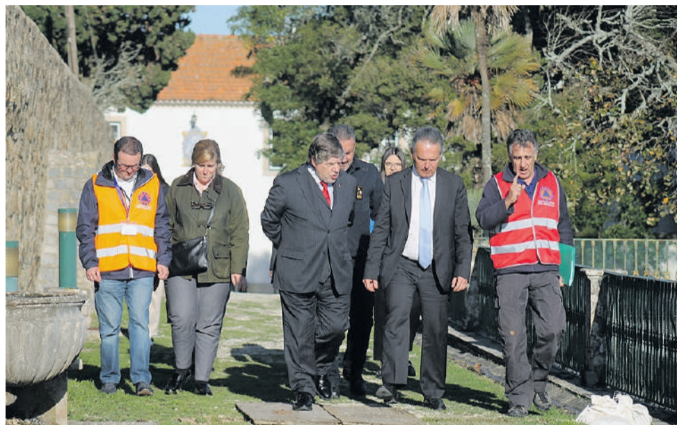
Secretário de Estado da Proteção Civil, Paulo Ribeiro, acompanhado de outras individualidades ligadas a várias áreas do sector dos bombeiros

Após a reunião com os responsáveis das autoridades portuguesas, as equipas iniciaram os preparativos no terreno para receber os restantes elementos dos módulos operacionais. O Secretário de Estado da