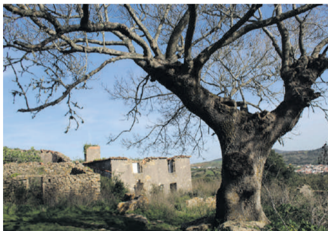
“Ruínas da Aldeia de Broas”