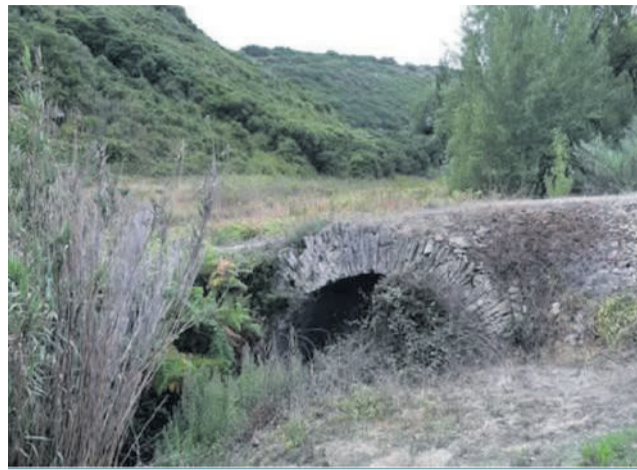
Ponte de Peroleite ou Ponte das Boiças no Rio Falcão