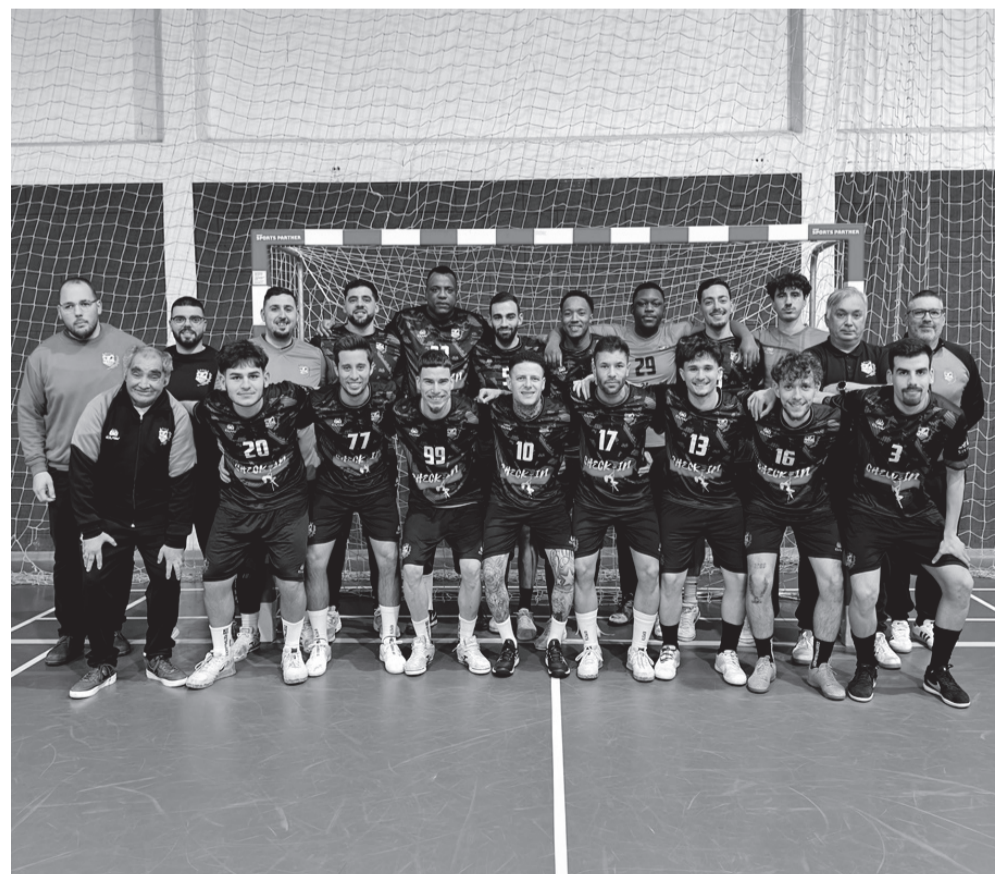
Novos Talentos, clube com história no Futsal volta a estar na ribalta da modalidade ao entrar na discussão da Taça AFL