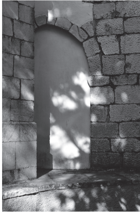
Igreja de São Pedro de Penaferrim, outrora São Pedro de Calafarrim e São Pedro de Canaferrim

Só na segunda metade do século XV, já abandonada a igreja velha, veremos grafada em documentos a nova igreja de S. Pedro de Calaferrim (1466), no antigo lugar de Calafarrim, da qual, já tínhamos conhecimento desde 1403. (6)