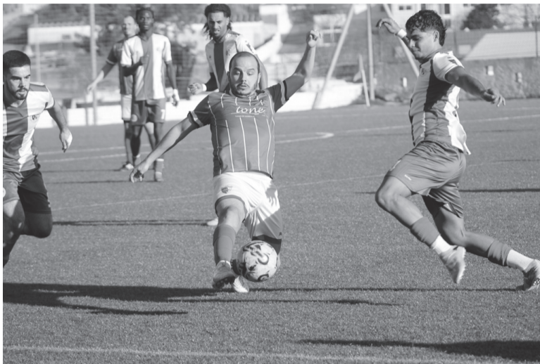
Muito empenho das duas equipas na conquista da vitória. O empate não agradou a nenhuma delas.

No segundo tempo, a pressão da turma visitante mudou o cenário, com maior controlo do meio campo, e jogadas de perigo na zona dos 40 metros. Duas grandes ocasiões, uma delas numa desatenção da defensiva local que praticamente ofereceu o golo de bandeja, mas caprichosamente a bola acabaria por passar junto ao poste. A outra foi anulada pela enorme intervenção de João Cabrita que desviou o potente remate por cima da barra da baliza.