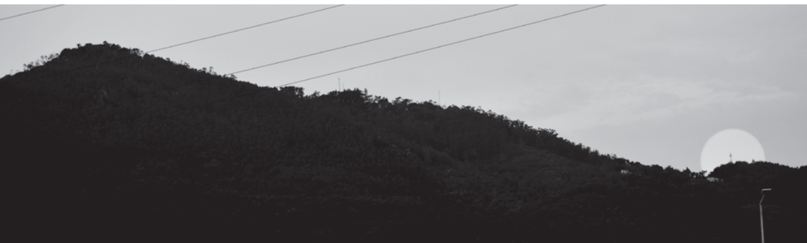
De Alcabideche, na linha visual com Cascais, quando a torre moderna do alto do Covelo é já a única estrutura de Sintra a poder visualizar esta parte Sul do território.