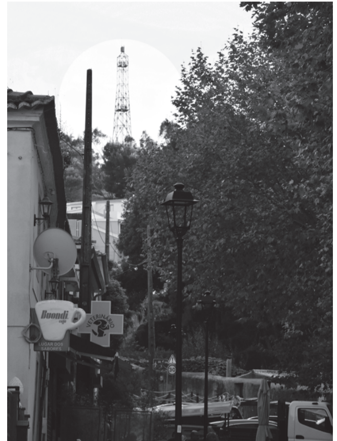
O alto do Covelo visto do princípio da estrada para Cascais e visto do Chão das Maias (“Largo da Feira”, Praça D. Fernando II), segundo a demarcação de 1469.