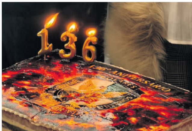
Bolo do aniversário

Seguiu-se o habitual almoço de confraternização nas instalações do Quartel, um momento de partilha de estórias, de reencontros e novas amizades. *com ahbvc