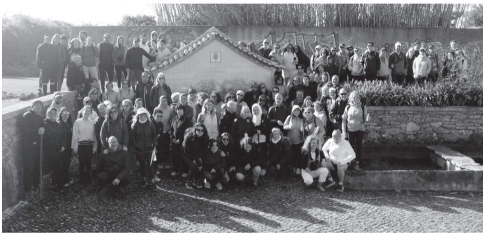
Fontainhas de Cima

N a agradável manhã, apesar de algum vento, de domingo, dia 15 de março, o percurso de cerca de 9 kms teve o seu início e término no Pavilhão do MTBA e foi concretizado por mais de uma centena de participantes, que, no início, receberam, além de um recipiente, fornecido pelos SMAS-Sintra, para encher de água, fruta e, no final da caminhada, sopa. O animado grupo e com vontade de caminhar percorreu alguns caminhos rurais e observou várias fontes e lavadouros (há quem afirme que estes eram as redes sociais dos anos 60 e 70). Após