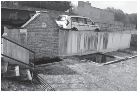
Fontainhas de Baixo