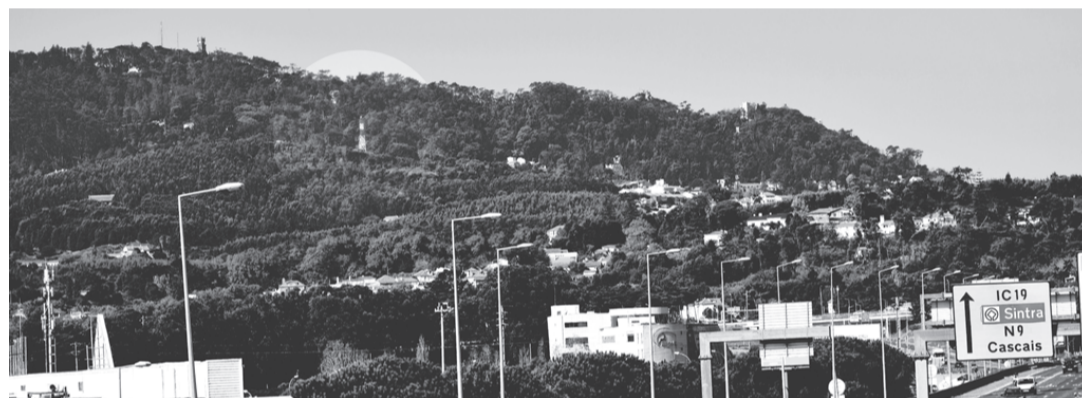
A torre moderna do alto do Covelo vista da ICI9, quando esta parte do território ainda é vista pela Pena, por Santa Eufêmia e pelo Castelo de Sintra.

agora Cabeço da Bezerra. Deve-se dizer que parece só ser assim chamado agora, provavelmente no séc. XX. Até ao final do Séc. XVIII, não temos este topónimo registado em nenhum documento que conheçamos. Em dois mapas do Séc. XIX, num é mencionado como “Alto da Tapada” e noutro, surge anónimo. O que terá acontecido?