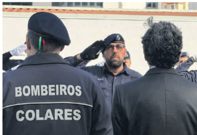
Guarda de honra