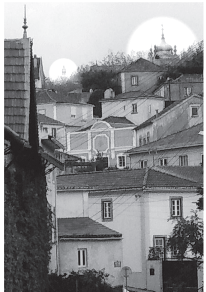
O alto do Covelo visto do alto de São Pedro e os dois pontos primordiais neste assunto, vistos da Rua do Roseiral.

pedro. partindo com os çarrados de sancta maria e espritall da parte do aguiam (Norte). e com a estrada que uay pera cascães . e doutra parte com a serra».