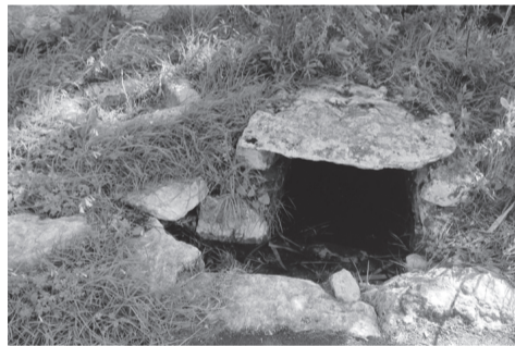
Fonte da Junqueira