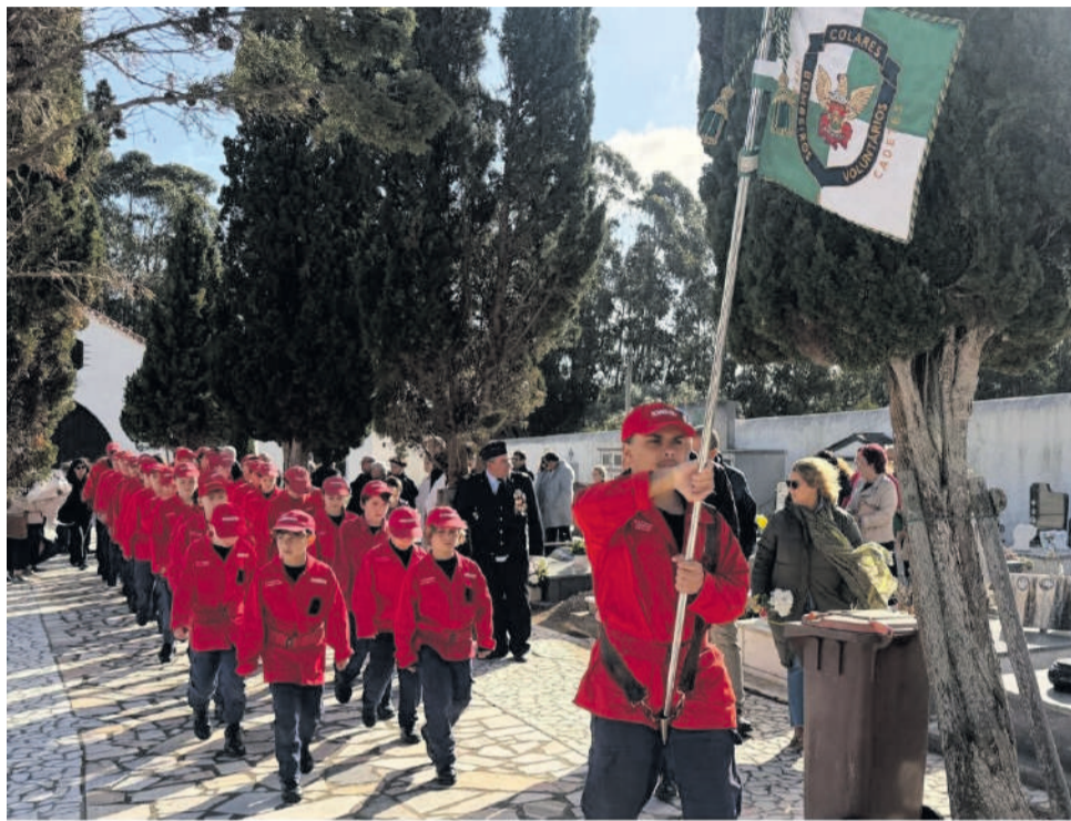
Romagem ao cemitério local

O ponto alto das celebrações ocorreu no domingo (15), uma manhã que começou com a tradicional romagem ao cemitério local lembrando quem já partiu e que teve papel importante na construção e percurso da Associação, sócios, dirigentes e bombeiros, e ainda uma Missa na Igreja Matriz de Colares em sua memória. Seguiu-se a passagem do cortejo com a Fanfarrá à cabeça, operacionais destacando-se um número significativo de Cadetes e Infantes numa aposta de continuidade do espírito voluntário dos soldados da Paz. E foi já no Salão Nobre repleto