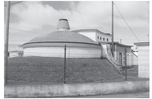
Depósitos de água