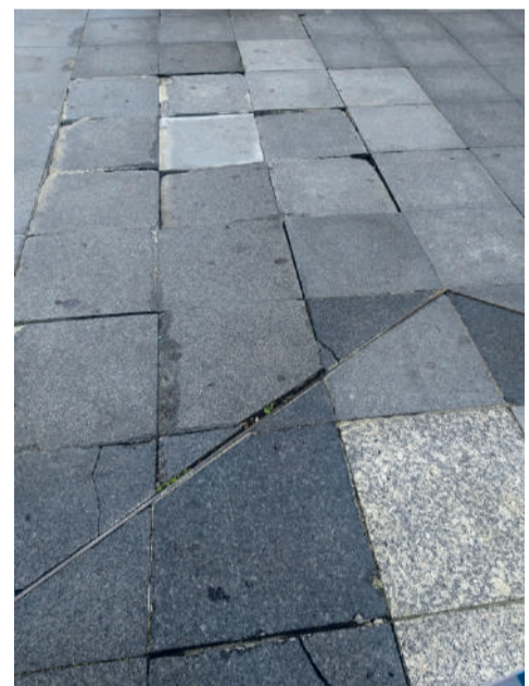
Nada de distrações! A queda espreita...

Segundo nos disseram os autarcas, numa primeira fase, até ao fim do mandato do actual executivo, que ocorrerá já no próximo mês de Setembro, o eléctrico já atravessaria a Av. Heliodoro Salgado, nos seus segmentos rodoviários e pedonal – acabando com aquele nefando sarcófago de uma artéria sem outra que não esta hipótese de requalificação – a caminho da estação terminal da CP.