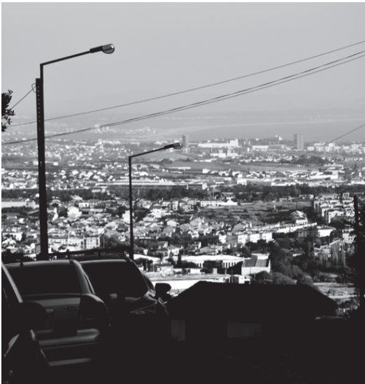
A barra do Tejo, a Sul, vista da Travessa do Chão das Maias, na encosta do monte do Covelo e, da mesma encosta, o Atlântico Norte, com a actual torre sineira da igreja no canto inferior direito.

Calculamos a actual Rua Marquês de Viana) da estrada (Rua Tude de Sousa) « donde parecee alberguaria » (as já mencionadas terras da Gafaria Velha chegavam até junto ao actual Fetal). Isto, tomando o Chão das Maias (actual Praça D. Fernando II), junto com São Pedro (São Pedro é ainda o Alto de São Pedro, com a sua igreja paroquial, e a sua torre militar que se tinha herdado do período muçulmano). Partindo com os cerrados de Santa Maria (por um documento de 1429 sabemos ter a Igreja de Santa Maria no Outeiro da Forca Velha, um ferragial e um pomar. Zona da Quinta de D. Dinis e a sua fronteira com a Rua Tude de Sousa) e com o « espiritall da parte do aguiam » (o Aguião era o Norte e estas terras do espiritall são as terras da Gafaria que já mencionámos próximas do actual Fetal e que desciam até ao Ramalhão.