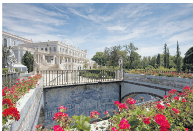
Palácio Nacional de Queluz