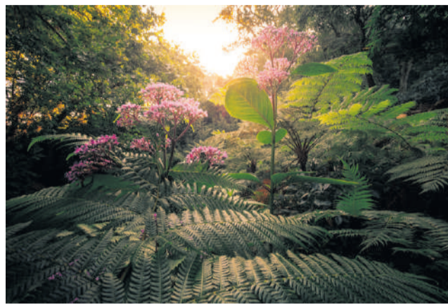
Parque de Monserrate

Para os apaixonados por jardinagem, decorre, às 11h30, na base do relvado, um workshop de propagação de plantas. Com uma abordagem acessível e participativa, a sessão será conduzida por um jardineiro-chefe da Parques de Sintra, que partilhará técnicas e conhecimentos úteis para aplicar no dia a dia. Quem se interessar especificamente por orquídeas, pode aproveitar para aprender mais com um especialista no culti-