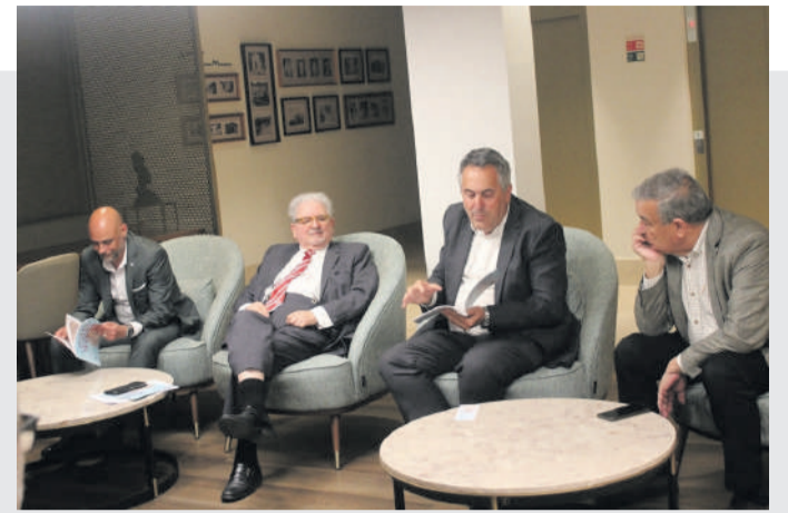
Mesa dos apresentadores do exemplar “O Pequeno Cavaleiro do Templo”

A obra, editada pela Diário de Bordo Editores pretende assim contribuir para o enriquecimento da leitura, valorizando a divulgação cultural em todas as áreas, especificamente a infanto-juvenil.