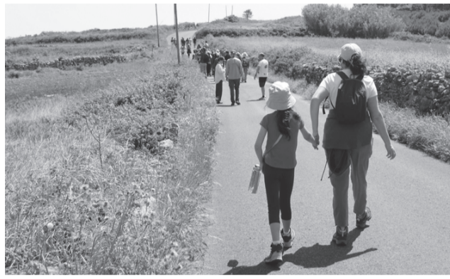
Várias dezenas de participantes

associados, e abordar o que cada um de nós pode fazer em prol da biodiversidade. Esta iniciativa foi organizada pela Câmara Municipal de Sintra, integrada no projeto “Trilhos Biodiversos”, em parceria com a SPEA, no âmbito do projeto LIFE LxAquila, e esteve relacionada com o Dia Mundial da Terra. O percurso visou também dar a conhecer a biodiversidade da região saloia do concelho de Sintra, com especial destaque