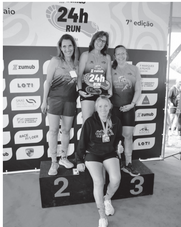
Equipa feminina – 1.º lugar