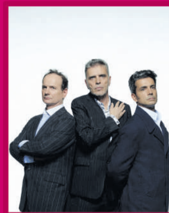
GNR 11.SET | 21H00