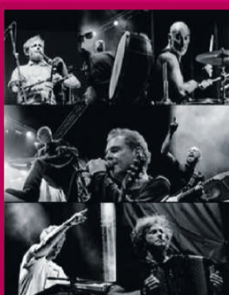
SÉTIMA LEGIÃO 03.JUL | 21H00