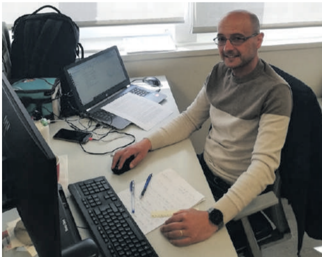
Actividade profissional exigente na área do Gás

No ano 1991, o Maratona CP organiza a Meia Maratona de Lisboa, com a novidade da travessia da Ponte sobre o Rio Tejo. O movimento das corridas mobilizou-se em redor da iniciativa, e foi um sucesso com mais de 3.000 a ter-