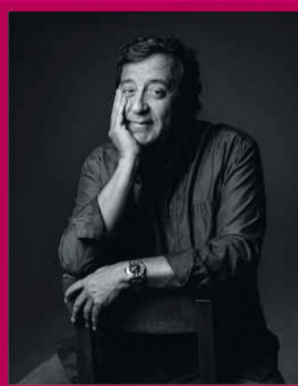
RUI VELOSO 24.JUL | 21H00