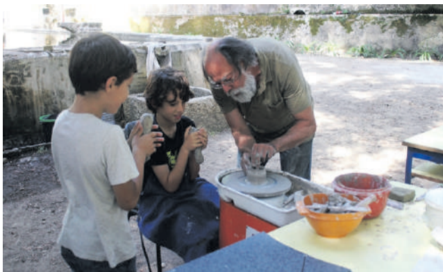
Oficina de Artes da Escola Mestre Domingos Saraiva