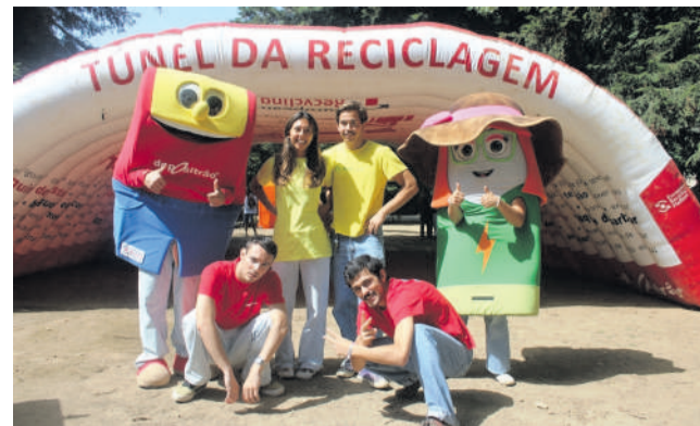
Voluntariado jovem indispensável na organização