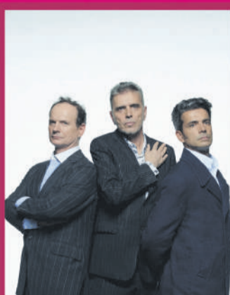
GNR 11.SET | 21H00