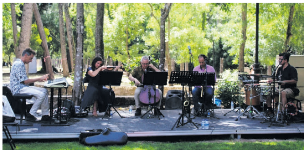
Concerto do Universus Ensemble patrocinado pela Fundação Cultur-sintra