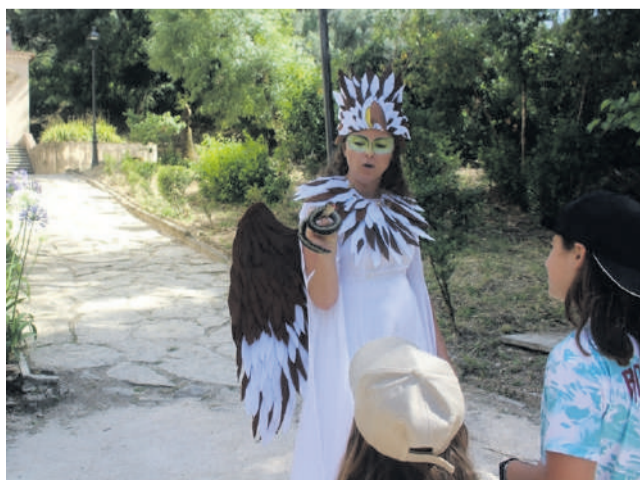
Actores profissionais na defesa das espécies protegidas

O evento contou com a participação de numerosos parceiros dos organizadores, destacando-se, para além dos já mencionados, o ICNF/PN-SC, Novo Verde, ERP Portugal, Águas do Tejo Atlântico, FSC Portugal, SPEA, Tratolixo, ABAAE, WWF, ADE-NE, Fundação Oceano Azul, e Protecção Civil de Sintra.