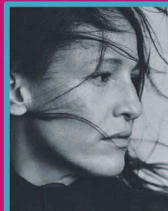
CARMINHO 01.OUT | 21H00