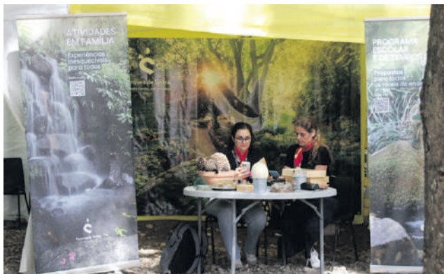
Parques de Sintra, parceira activa do evento