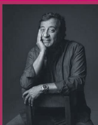
RUI VELOSO 24.JUL | 21H00