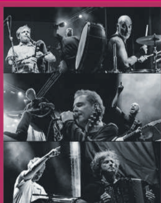
SÉTIMA LEGIÃO 03.JUL | 21H00