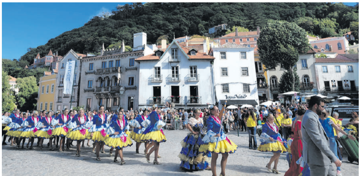
Grupo União Recreativo e Desportivo do MTBA