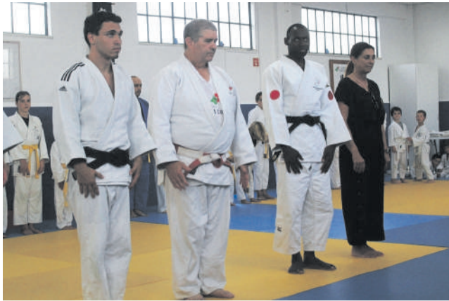
Cumprimento ao público ( Ritsurei )