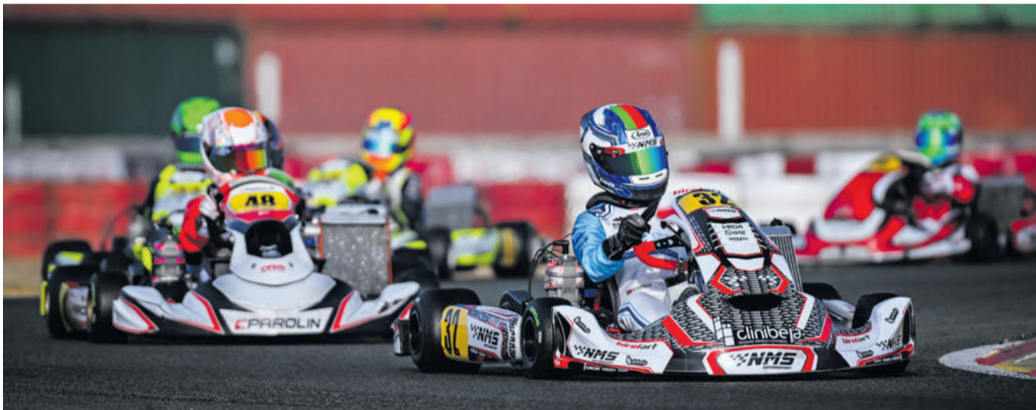
Fase da corrida com muitos competidores em pista

Texto e fotos: Kako Marques / KMCom Assessoria