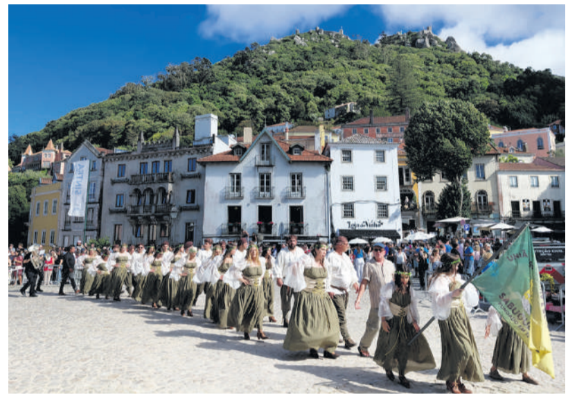
União Desportiva e Recreativa Sabugense