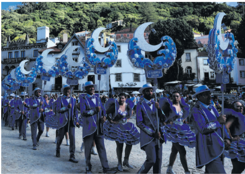
Associação Cultural, Social e Recreativa de Cabriz