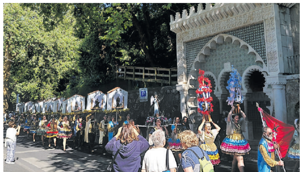
Sociedade Futebol Club “Os Odrinhenses”