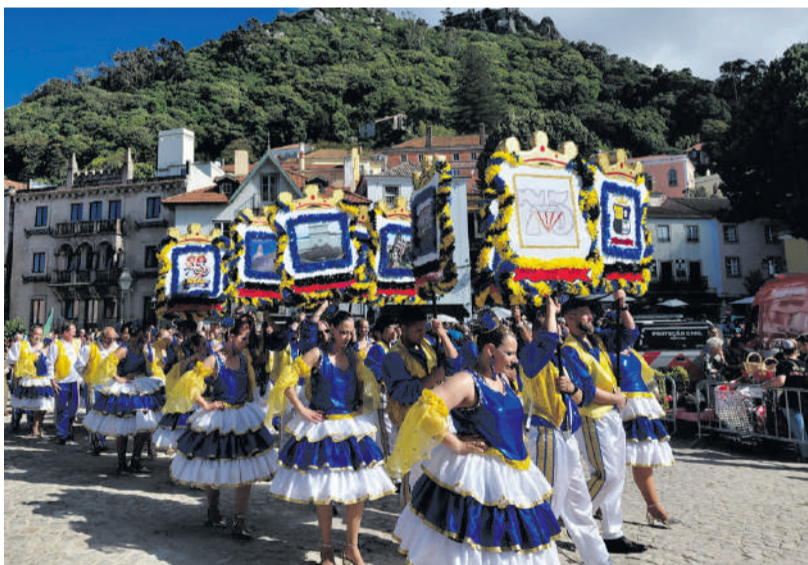
Real Sport Clube de Massamá