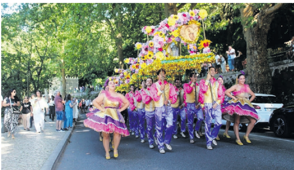
São João das Lampas