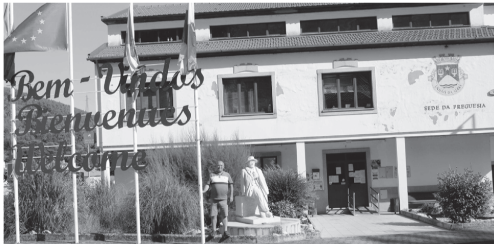
Unhais da Serra

Recentemente (1 de julho) o autor deste artigo, que foi autarca na Freguesia de São João das