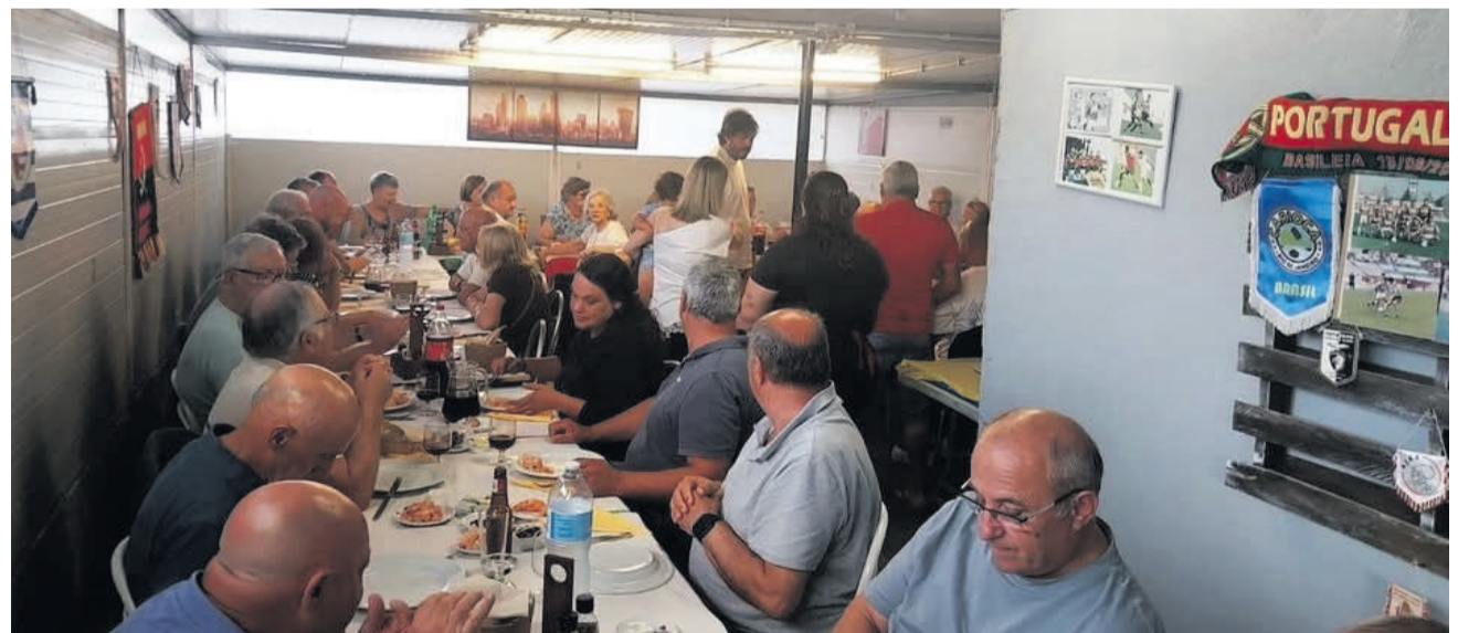
Confraternização foi o ponto dominante entre os associados envolvidos na celebração dos 93 anos da SRA