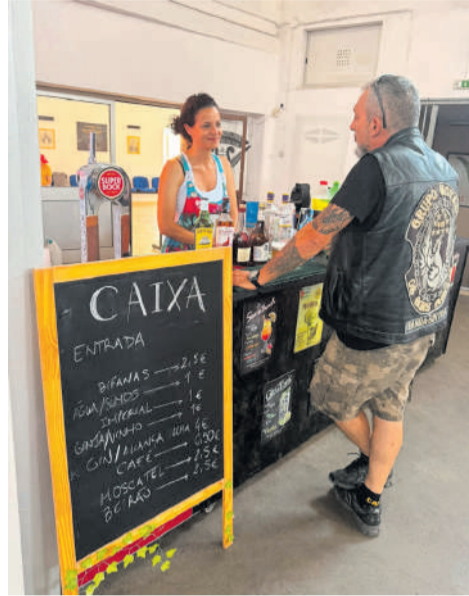
Com a onda de calor, o bar não teve mãos a medir e esgotou, nomeadamente as bebidas