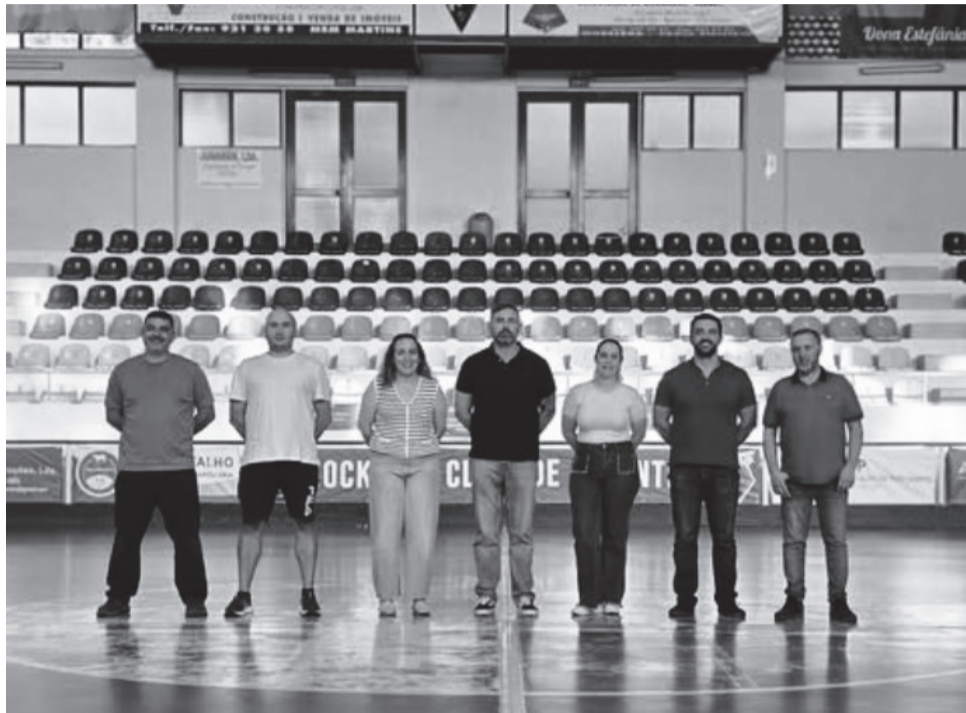
Direcção eleita para o biênio 2026-28