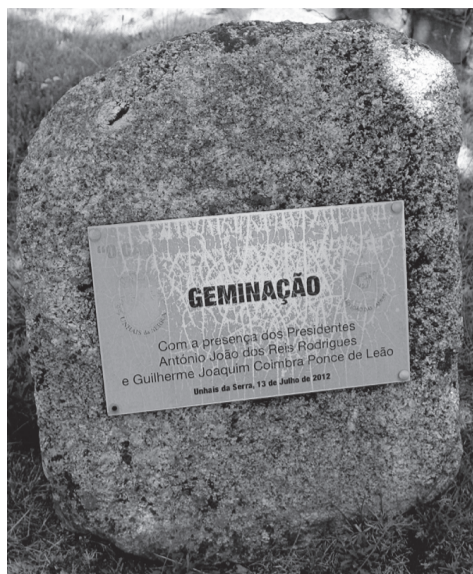
Cantinho de São João das Lampas em Unhais da Serra