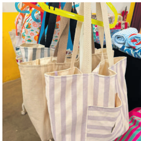
Comércio local e artesanato aproveitaram para mostrar os seus produtos

Registe-se que no dia 6 (segunda-feira), a Biblioteca do Grupo de Bandolinistas 22 de Maio, assinalou os 85 anos de actividade, uma efeméride assinalada pela actual Direcção relevando o valor cultural, alcance social, e educativo desse espaço de conhecimento que se mantém activo, sob o lema “85 anos a guardar livros. E, acima de tudo, memórias”.