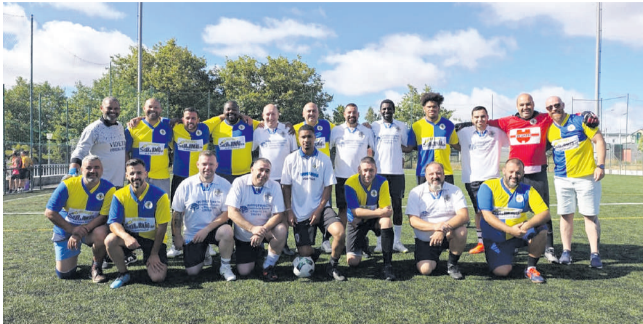
Antigos jogadores formaram 2 equipas – Futebol 7 – para um desafio na Escola Secundária de Mem Martins