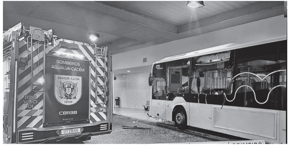
Bombeiros de Agualva-Cacém com forte dispositivo no socorro às vítimas

O alerta foi dado cerca das 09h45 de terça-feira, dia 7, para um acidente envolvendo um autocarro da Carris Metropolitana no terminal de acesso à Estação da CP de Agualva-Cacém provocando a morte imediata de duas pessoas, e deixando 15 feridas, conforme adiantou numa nota à Comunicação Social a Unidade de Saúde Local Amadora/Sintra, e citamos: “A instituição prestou assistência a um total de 15 utentes que chegaram ao Hospital Professor Doutor Fernando Fonseca. Do total de utentes admitidos, 1 utente foi triado como muito urgente (pulseira laranja), 7 foram triados como urgentes (pulseira amarela) e 7 com prioridade pouco urgente (pulseira verde), de acordo com o Sistema de Triagem de Manchester. Os utentes admitidos têm vindo a ser